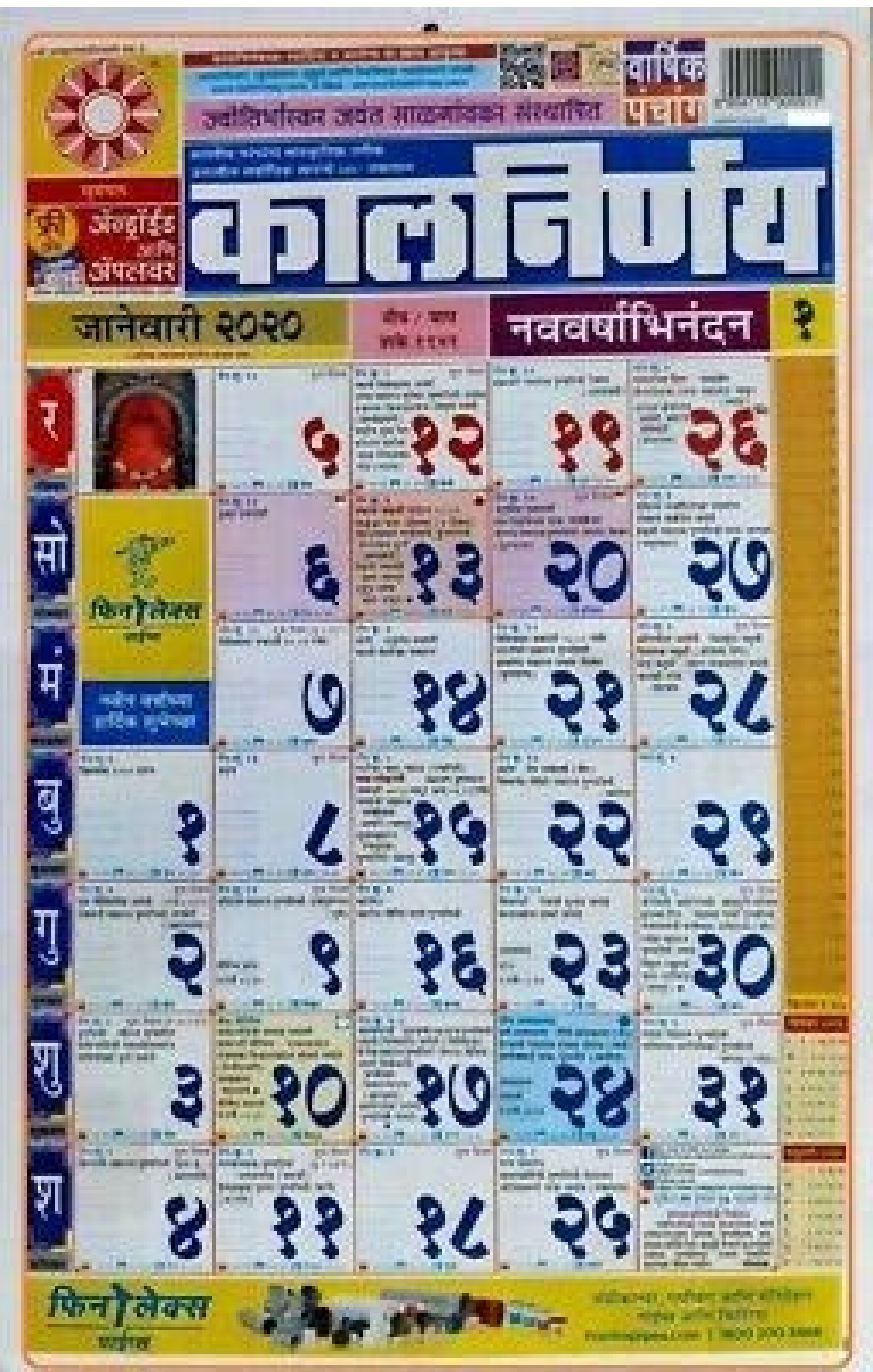
2018 Marathi Panchang Calendar @ 1234newyear.com