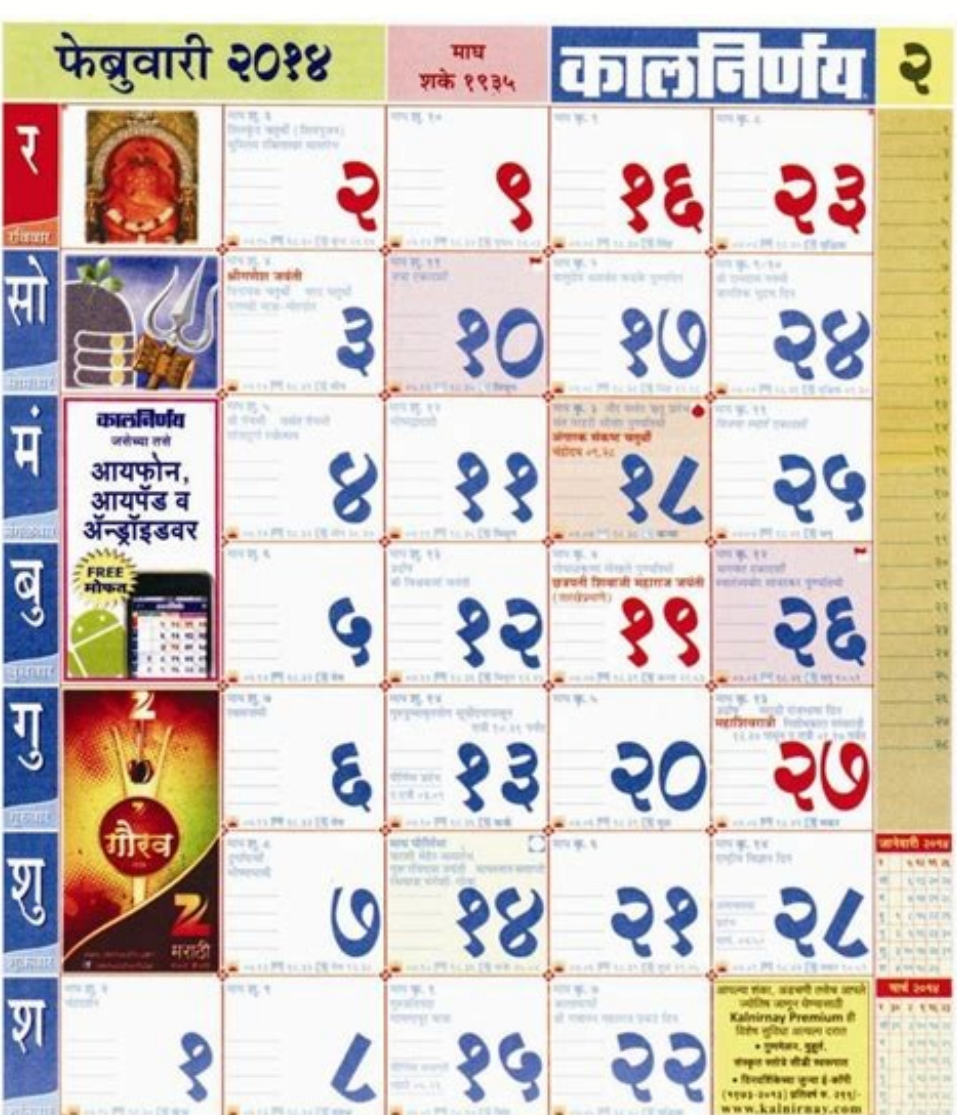
2018 Marathi Panchang Calendar @ 1234newyear.com